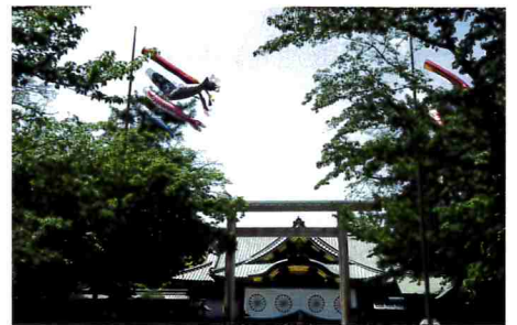
5-6月 新緑の靖國神社