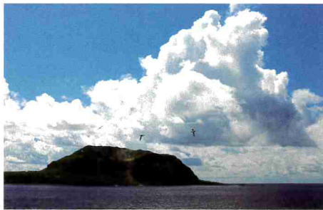
3-4月 硫黄島（東京都・小笠原村）