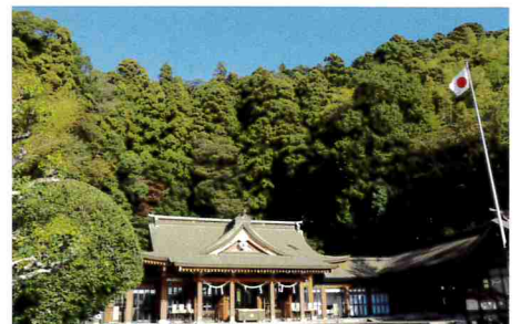
11-12月 御祭神77,612柱・鹿児島縣護國神社