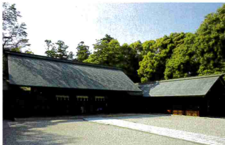
9-10月 御祭神34,750余柱・滋賀縣護國神社