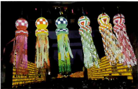
7-8月 期間中約14万人の人出で賑わった令和元年靖國神社みたままつり(毎年7月13日～16日)