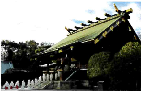
1-2月 靖國神社新年祭