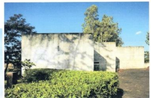
(インド国民軍博物館)