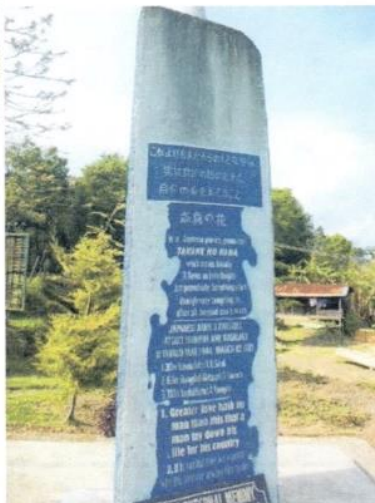
(ウクルル日本軍慰霊碑/上)