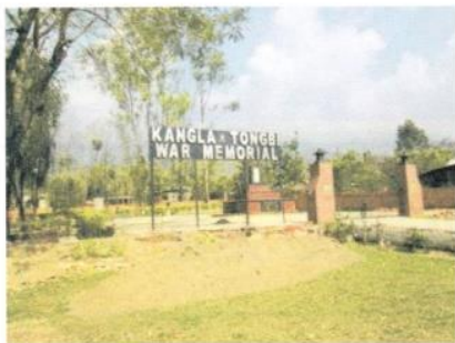
(カンガトンビ戦跡公園/上)