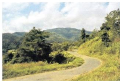
(激戦地ウクルル街道)