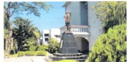
(インド国民軍博物館)